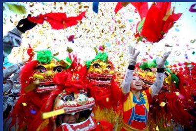
Китайский Новый год